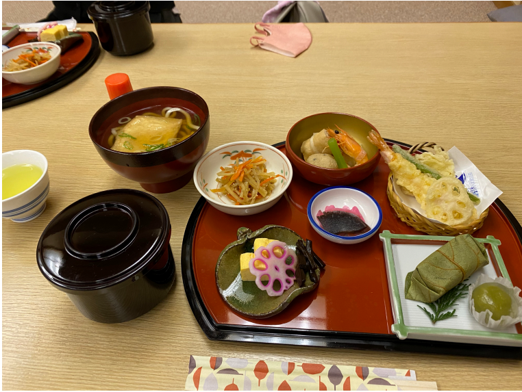
出来立てうどんが体を温める！